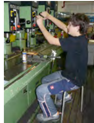
ESAB Cutting Systems, Karben